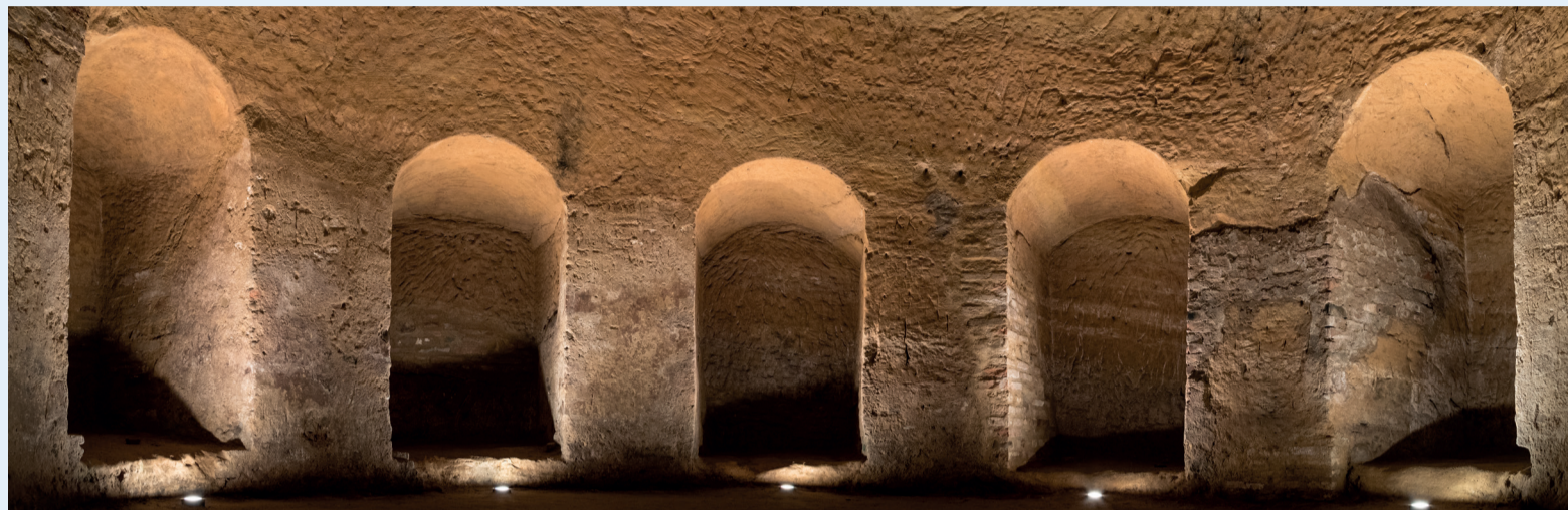
La grotta monumentale di via Ruggeri

Grazie alla tecnologia dei beacon e alla nuova app turistica, Santarcangelo si trasforma in un museo all'aria aperta