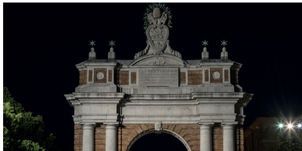
L'arco dedicato a Papa Ganganelli è ora del Comune di Santarcangelo grazie al trasferimento di proprietà dall'Agenzia del Demanio