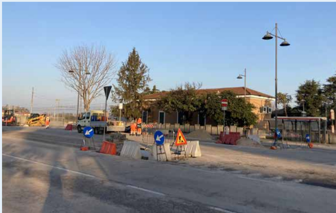
Il cantiere in piazzale Esperanto

A finanziare l'intervento, per un totale di circa 95mila euro, i contributi assegnati al Comune da Agenzia Mobilità Romagnola, attraverso la Regione Emilia-Romagna, per la qualificazione del trasporto pubblico locale, relativi alle annualità 2020 e 2021. Delle risorse complessive, 60mila euro finanziano il primo stralcio per l'esecuzione dei lavori stradali, mentre la restante quota servirà per l'acquisto e l'installazione degli arredi.