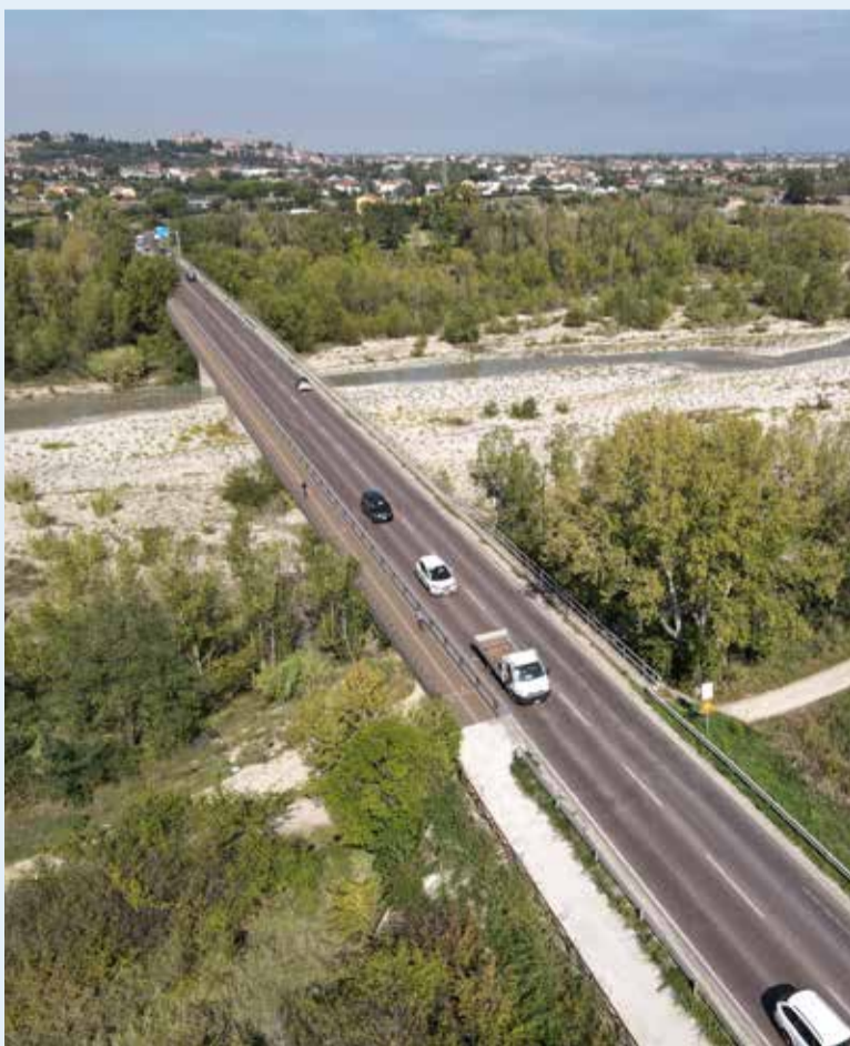
Il rendering del collegamento ciclopedonale sul ponte Marecchia

Approvati i progetti esecutivi di due tratti del collegamento ciclopedonale tra il centro di Santarcangelo e le frazioni di San Martino dei Mulini e Sant'Ermete: i lavori inizieranno nel 2023 e saranno completati nel 2024.