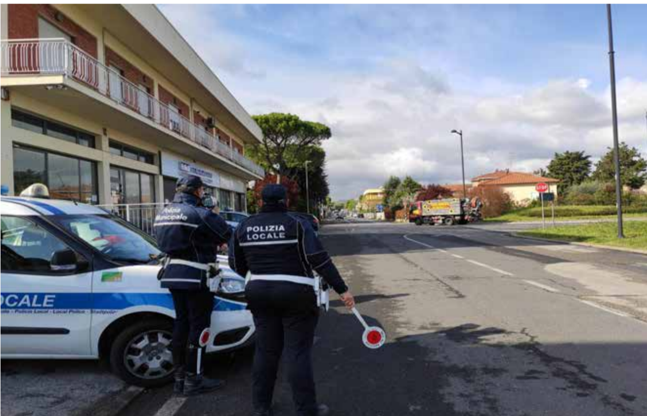
I controlli della Polizia locale in via Ugo Bassi

Dopo la pausa forzata causata dalla pandemia, nel 2022 è tornata a consolidarsi l'attività degli agenti per l'educazione stradale in bici e a piedi, che ha visto la partecipazione di 10 scuole primarie di Santarcangelo, Verucchio e Poggio Torriana.