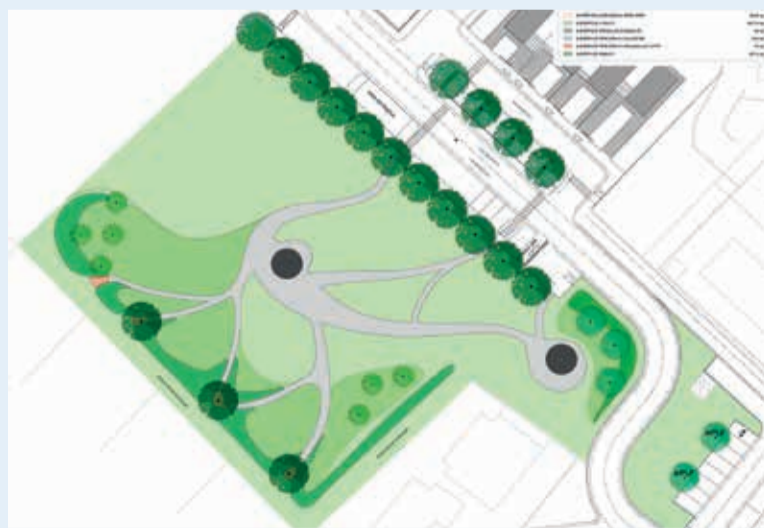
Il progetto per la nuova area verde di San Michele

Rispetto a quest'ultima, la convenzione approvata dalla Giunta comunale nelle scorse settimane prevede infatti, in aggiunta alle dotazioni standard, la realizzazione di 550 metri di percorso ciclopedonale lungo il tracciato della ex ferrovia Santarcangelo-Urbino, a completamento di quelli già pianificati nell'ambito dell'accordo con l'azienda Paglierani e della lottizzazione "Forever green" in via Scalone. Circa 200mila euro il costo dell'intervento: tra i contributi di sostenibilità figurano inoltre più di 3mila metri quadrati di verde pubblico e 80 posti auto, oltre alla