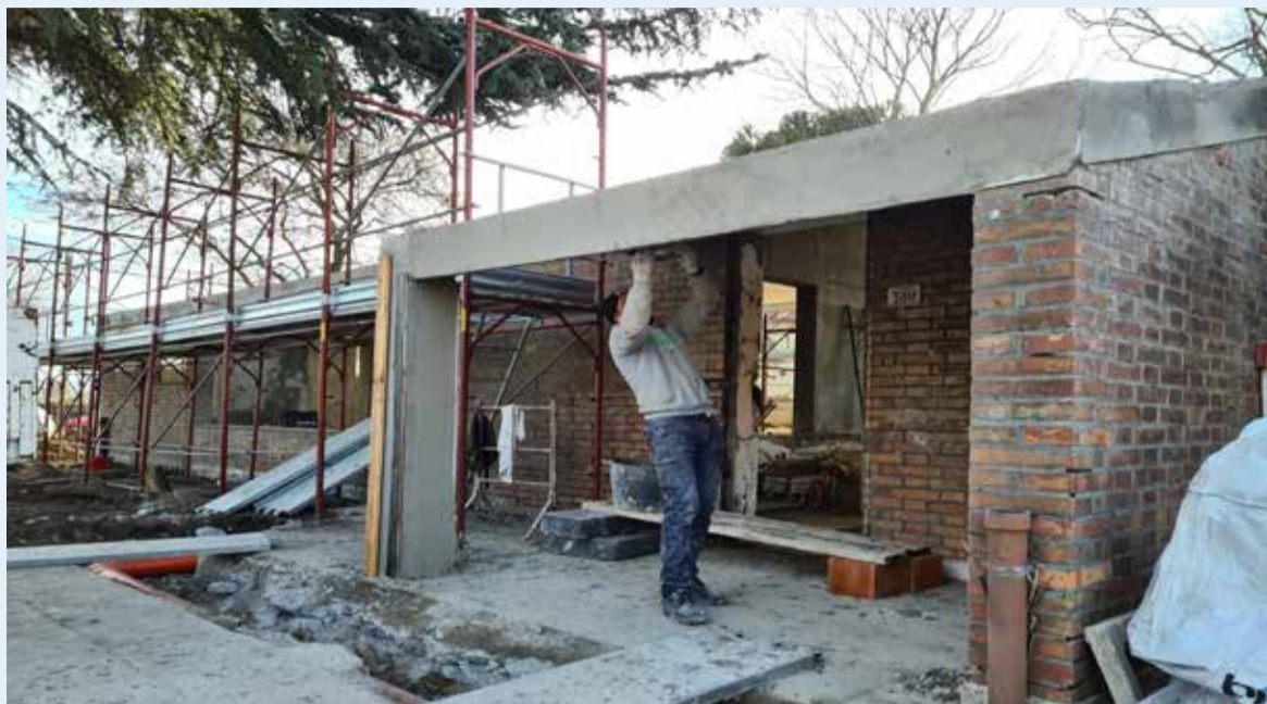
I lavori in corso alla ex scuola del Bornaccino

Preservate le caratteristiche di un edificio simbolo della pedagogia che presto ritornerà alle sue funzioni educative come spazio per i giovani