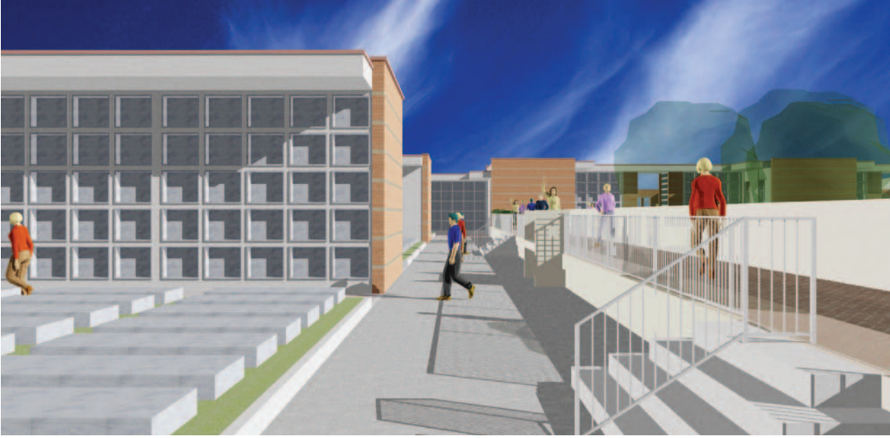
Il rendering dell'ampliamento del cimitero centrale