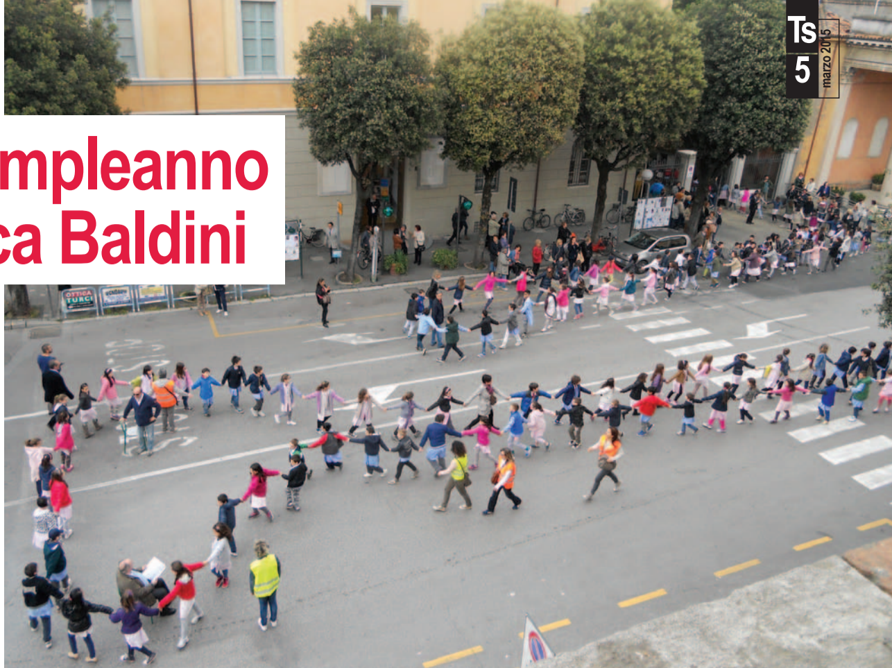
23 aprile 2014, la nuova Baldini inaugurata dalla catena umana formata dai bambini delle scuole

Giovedì 23 aprile, giorno del compleanno, si festeggerà con lo spettacolo teatrale "Il diario segreto di Pollicino" a cura della Compagnia Angelini-Serrani/Teatro Patalò, riservato ai più piccoli (inizio ore 17), mentre alle 21 Silvio Castiglioni interpreta e legge "Casa d'altri" dal racconto di Silvio D'Arzo e "La lucina", dal libro di Antonio Moresco. Al termine si festeggia con la classica torta di compleanno e un brindisi benaugurale.