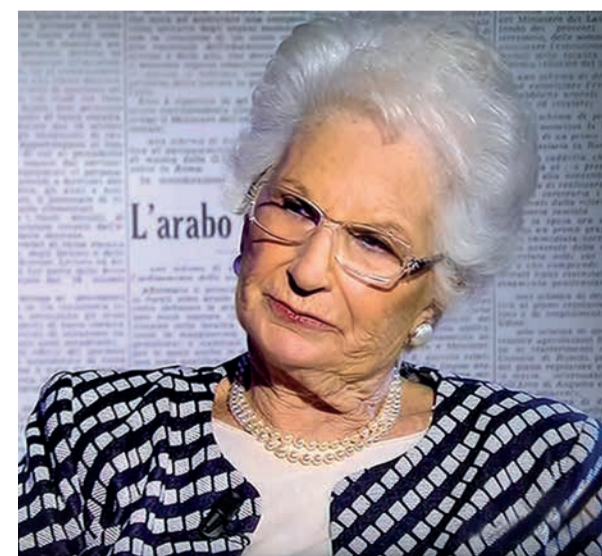
La senatrice Liliana Segre

L'ordine del giorno del consigliere Danilo Nicolini (Lega Salvini premier Romagna), relativo alla richiesta di sospensione dell'addizionale regionale sul gas naturale, è stato approvato con il voto favorevole dell'opposizione e l'astensione della maggioranza, mentre la mozione presentata dal consigliere Marco Fabbri (Partito Democratico) per il conferimento della cittadinanza onoraria di Santarcangelo alla senatrice Liliana Segre ha ottenuto voto unanime. A concludere la seduta la mozione del consigliere Patrick Francesco Wild (PenSa-Una Mano per Santarcangelo) per l'adesione del Comune alla Rete per l'integrità e la trasparenza