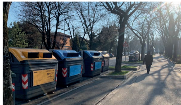
Un'isola ecologica lungo viale Marini

Nel corso del 2021 sono state 25 le sanzioni elevate dalle Guardie am-