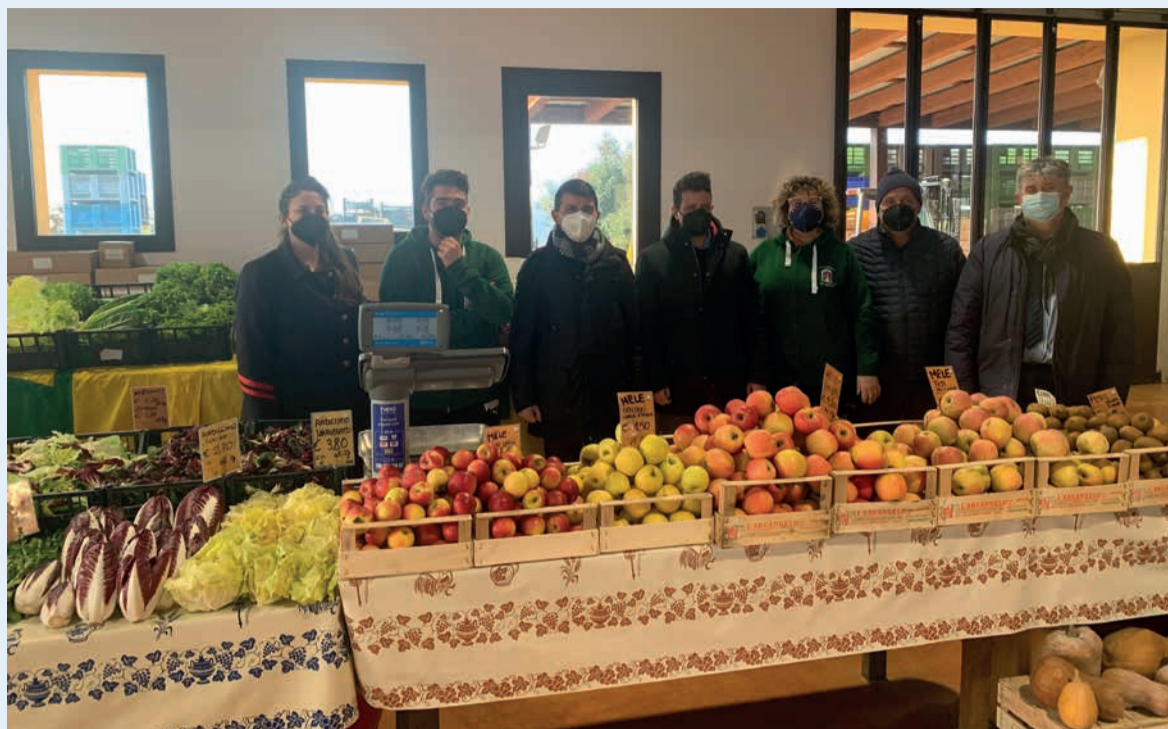
Un momento della visita dell'assessore regionale all'Agricoltura Alessio Mammi (terzo da sinistra) presso una delle aziende agricole della valle dell'Uso

Per l'assessore regionale Mammi, "Il sostegno alle imprese agricole è fra le priorità della Regione, che su questo fronte impegna risorse proprie e fondi provenienti dall'Unione Europea: misure che proseguiranno con nuovi investimenti per le imprese agricole per un valore che si attesta a 120 milioni di euro e l'impegno di mettere a bando tutti i 408 milioni di euro del Programma di Sviluppo Rurale entro l'estate. Le aziende agricole che ho avuto modo di visitare dimostrano quanto sia importante la combinazione fra un'imprenditoria innovativa e intergenerazionale e l'attenzione dell'Amministrazione