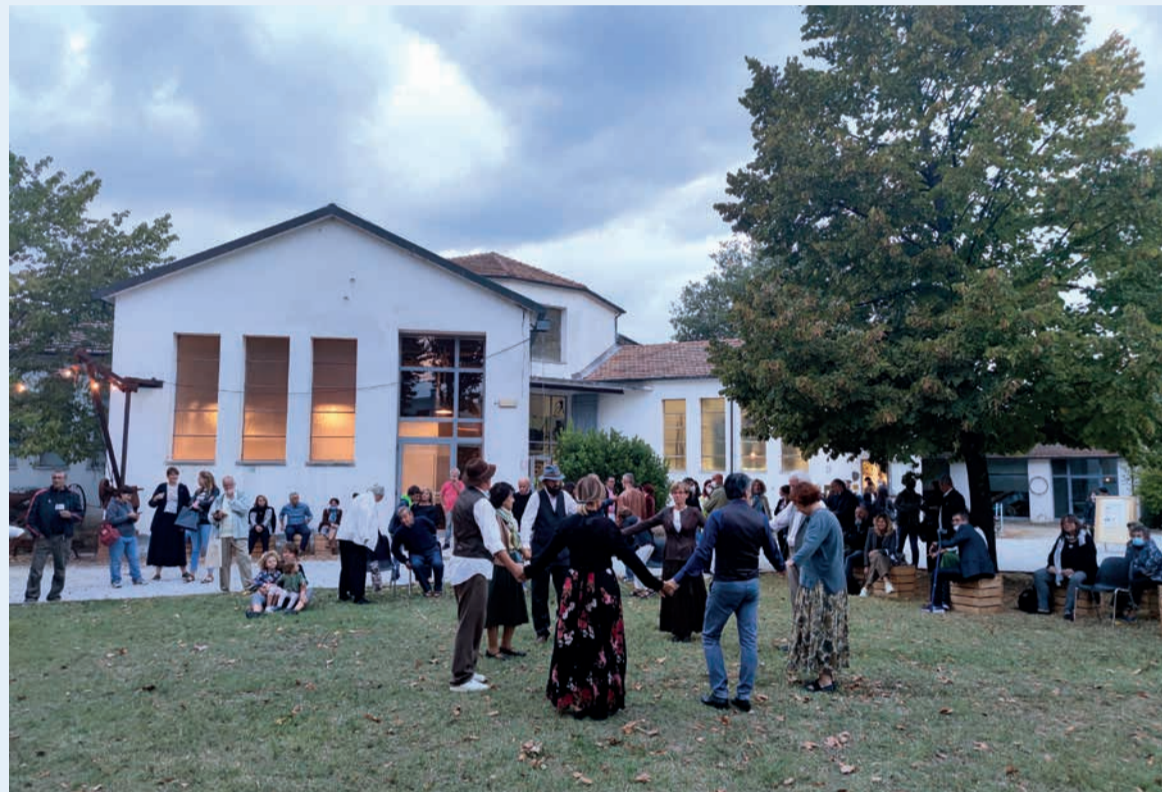
La riapertura del Museo etnografico, ottobre 2021: un momento della festa inaugurale per il completamento dei lavori

to della sua istituzione, negli anni '70 – con questo intervento potrà tornare allo splendore degli esordi. Da qualche anno il Met ha iniziato la sua trasformazione in un museo urbano, protagonista di una scena culturale innovativa: l'adeguamento strutturale, non più rinviabile, consentirà anche un aggiornamento agli standard contemporanei di accessibilità.