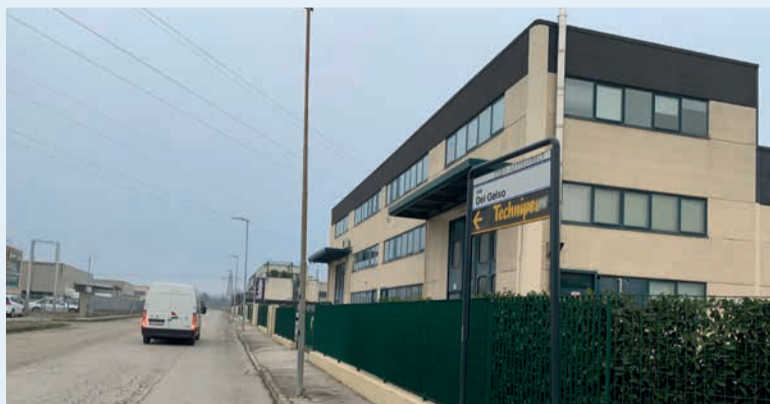
La zona artigianale di Santa Giustina

Dopo il via libera al progetto di fattibilità tecnico-economica per la riqualificazione e riorganizzazione del parcheggio di via del Pino, la grande area a servizio della zona artigianale presente lungo la via Emilia in buona parte destinata alla sosta di camion, la Giunta comunale ha approvato un ulteriore intervento di manutenzione straordinaria per altre tre vie all'interno dell'area produttiva.