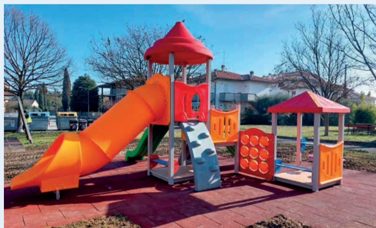
Parco di via Casanova a San Vito, installata la nuova struttura gioco in plastica riciclata

Supera gli 800mila euro, tra interventi già effettuati e programmati, l'investimento dell'Amministrazione comunale per la manutenzione e la riqualificazione dei parchi nel 2021. Nella parte finale dell'anno, inoltre, le principali aree verdi della città sono state oggetto di un monitoraggio puntuale, mentre in diversi luoghi di Santarcangelo sono stati installati cestini per la raccolta dei rifiuti.