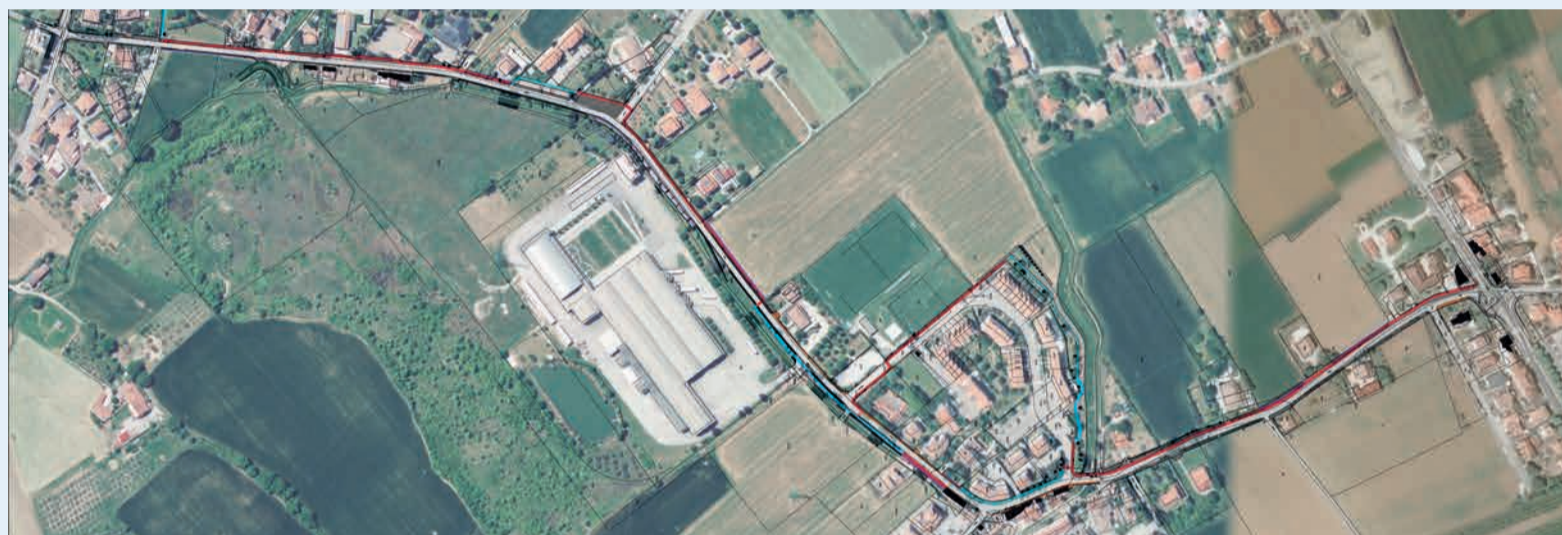
Il tracciato del futuro percorso ciclo-pedonale lungo via Casale Sant'Ermete

Due invece i monitoraggi effettuati sulle emissioni degli impianti presenti in via Pedrignone e via Morandi. Da un'abitazione privata della stessa via Pedrignone, a 70 metri di distanza, in 62 giorni di rilevazioni tra aprile e giugno è stato registrato un valore medio di 0,82 V/m e un massimo di 2,10 V/m. Da via Pascoli, anche in questo caso presso un'abitazione privata distante 70 metri dall'impianto più vicino, in 20 giorni tra luglio e agosto la centralina ha rilevato una media di 0,87 V/m e un valore massimo di 1,84 V/m.