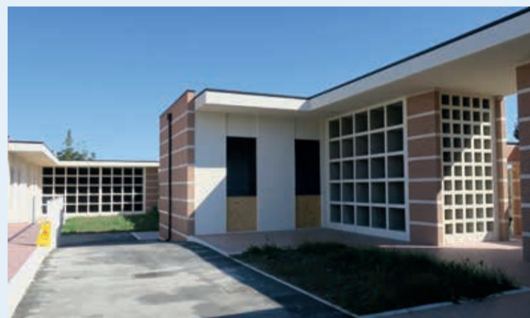
Una parte dell'intervento di ampliamento al cimitero centrale