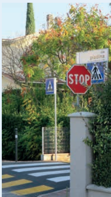
Il nuovo attraversamento pedonale in via Piadina finanziato con il Bilancio partecipato