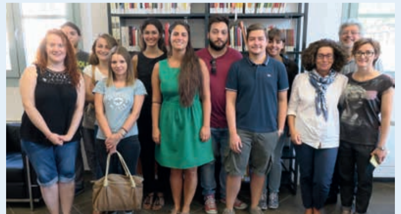
Il saluto di benvenuto del sindaco Parma ai ragazzi e alle ragazze del Servizio Civile

biblioteca con il progetto "Leggere e conoscere", uno all'Istituto dei Musei Comunali con "Raccolte ed uso pubblico" e quattro presso i Servizi Sociali dell'Unione di Comuni Valmarecchia con il progetto "Per una Valmarecchia solidale".