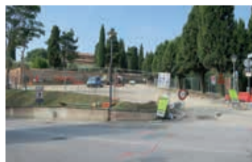
I lavori al parcheggio dei Cappuccini

prevede la sistemazione definitiva del parcheggio Cappuccini, che avrà una pavimentazione drenante e un nuovo impianto di illuminazione. Circa 50 i posti auto previsti, a cui si aggiungeranno una ventina di stalli per motociclette e un posto auto per disabili. L'attraversamento in corrispondenza dell'incrocio con via Cupa e via Pozzolongu, inoltre, verrà messo in sicurezza grazie alla realizzazione di una rotatoria, mentre saranno rivisti anche gli attraversamenti pedonali verso via Cupa e via Malatesta. Il caratteristico viale alberato che conduce ai frati Cappuccini, infine, verrà pedonalizzato, dal momento che sarà possibi-