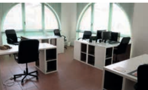
Uno degli spazi di coworking a Palazzo Francolini Franceschi

Prende forma l'iniziativa annunciata nello scorso mese di giugno dalla Fondazione Francolini Franceschi e dal Comune di Santarcangelo, finalizzata a mettere a disposizione di quattro giovani professionisti uno spazio di lavoro gratuito in coworking attraverso un bando che si è chiuso il 30