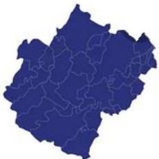
Tabella comuni Cesena