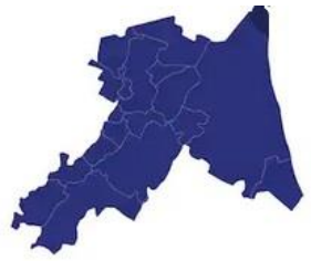
Tabella comuni Ravenna