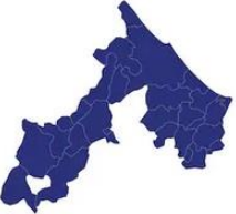
Tabella comuni Rimini