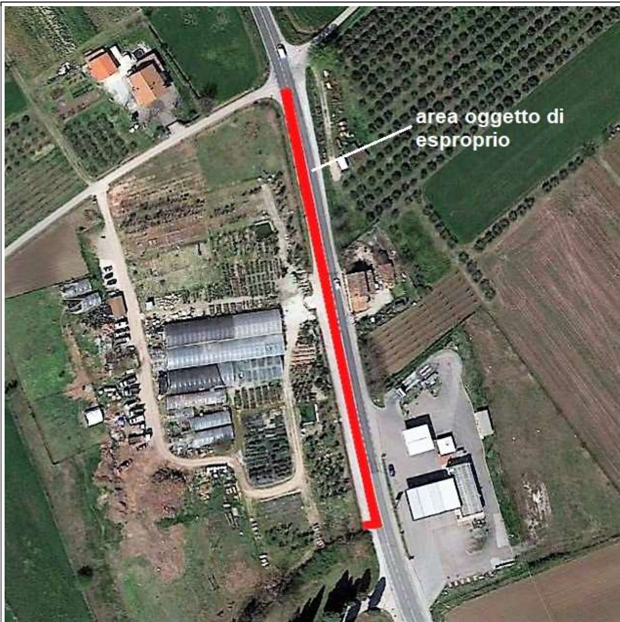
Individuazione dell'area interessata dal progetto della pista ciclabile