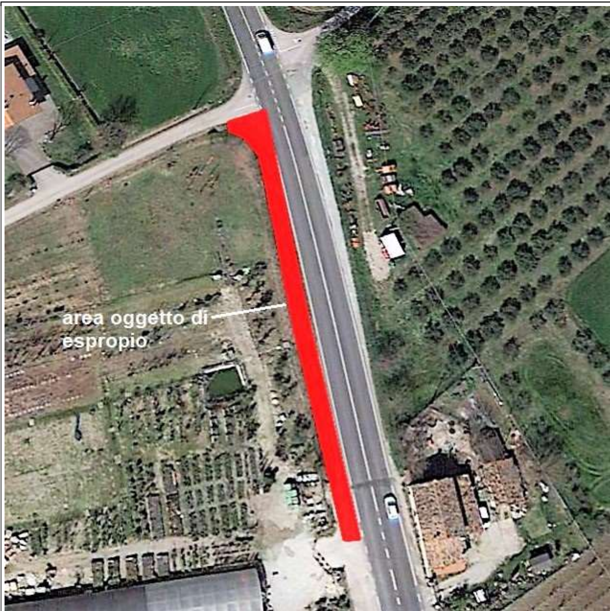
Individuazione dell'area interessata dal progetto della pista ciclabile