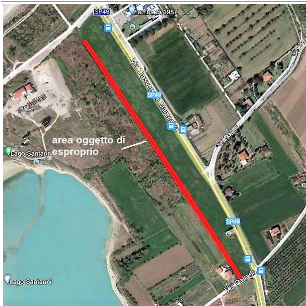
Individuazione dell'area interessata dal progetto della pista ciclabile