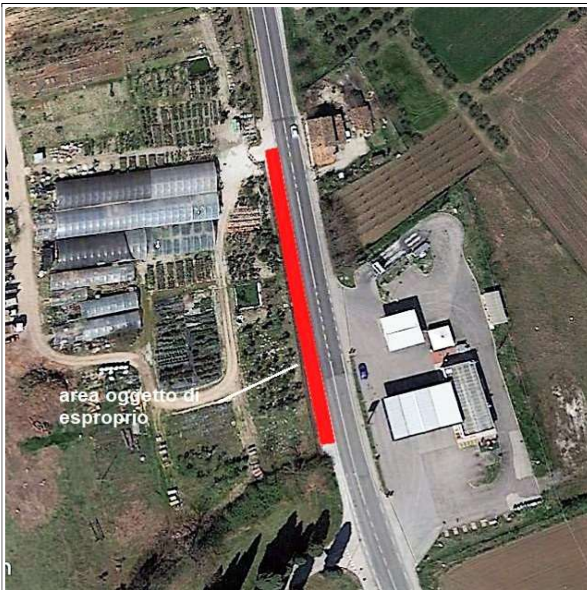
Individuazione dell'area interessata dal progetto della pista ciclabile