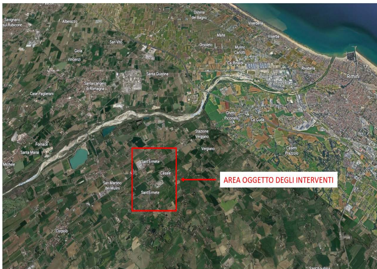
Foto satellitare con localizzazione dell'area oggetto degli interventi

La via interessata dagli interventi è denominata Via Casale Sant'Ermete è localizzata in Provincia di Rimini, Comune di Santarcangelo di Romagna, frazione di Sant'Ermete.