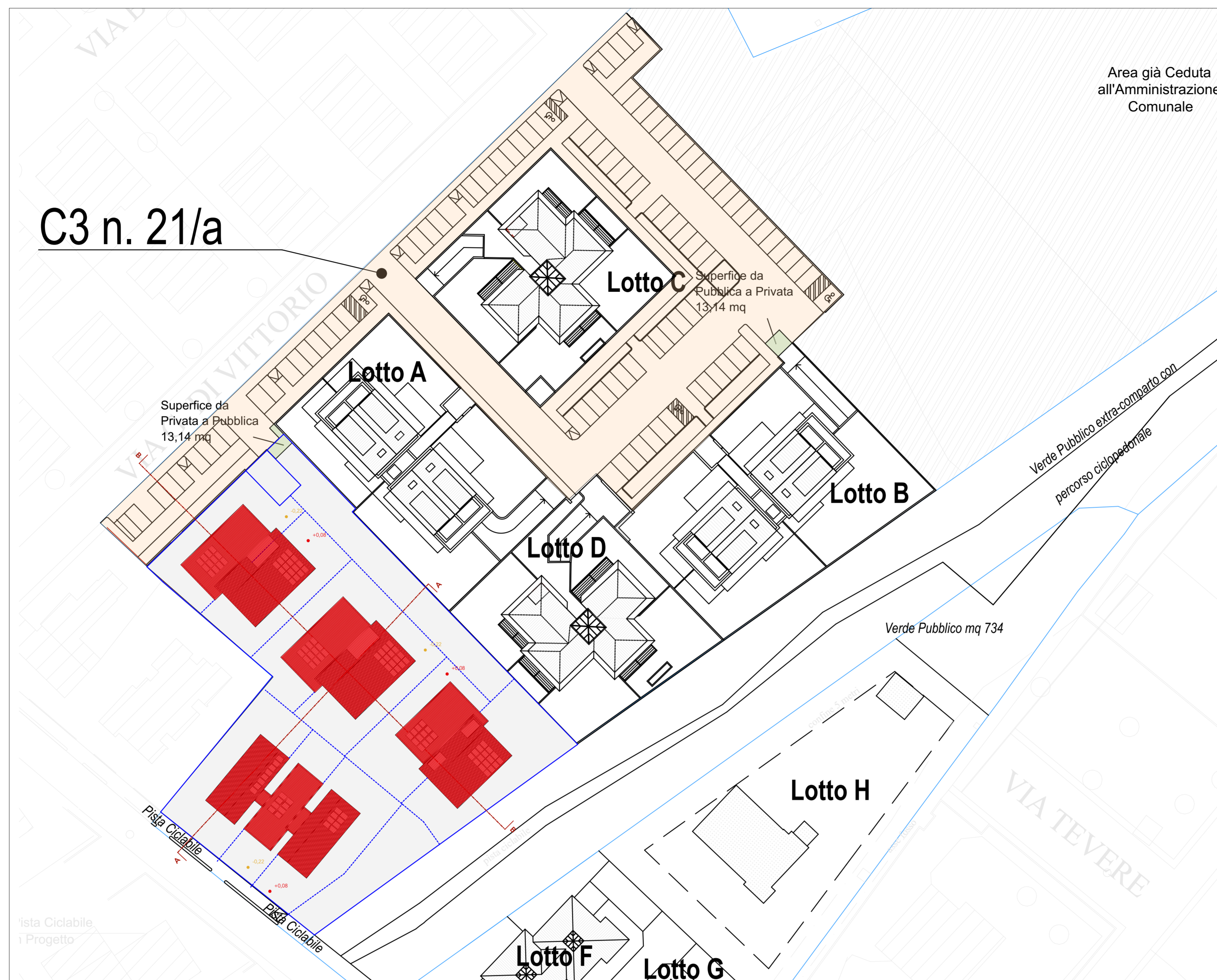
PLANIMETRIA GENERALE E SEZIONI AMBIENTALI SCALA 1:500