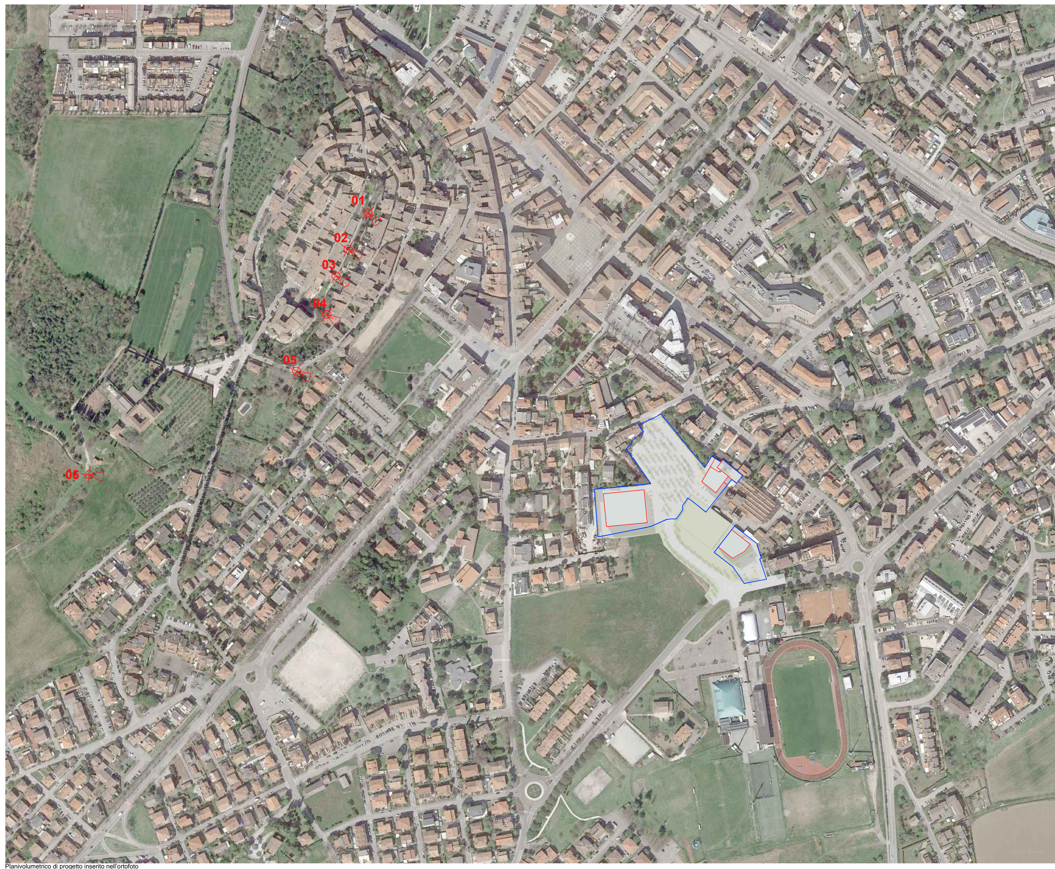
Pianivolumetrico di progetto inserito nell'ortofoto