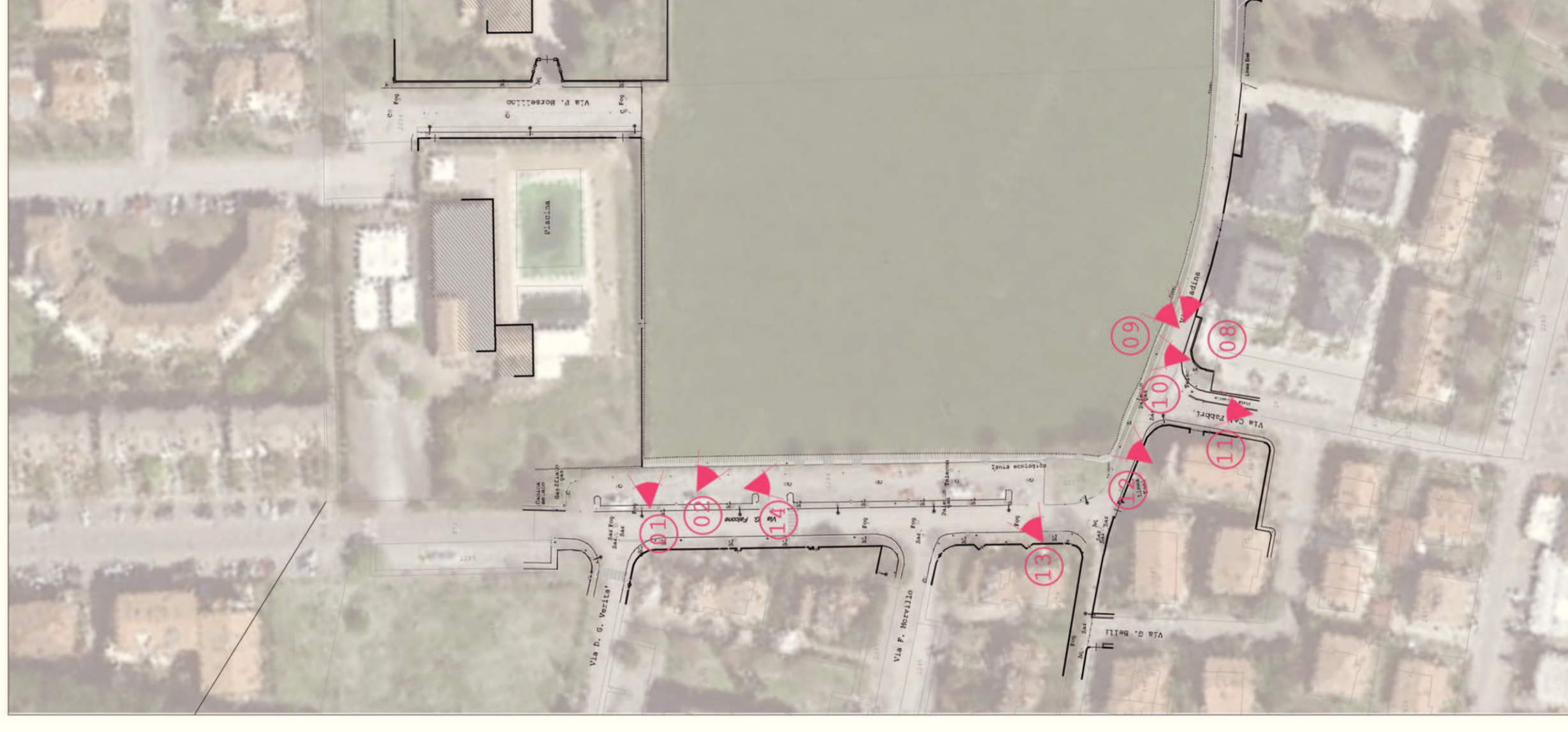
Planimetria con punti di ripresa