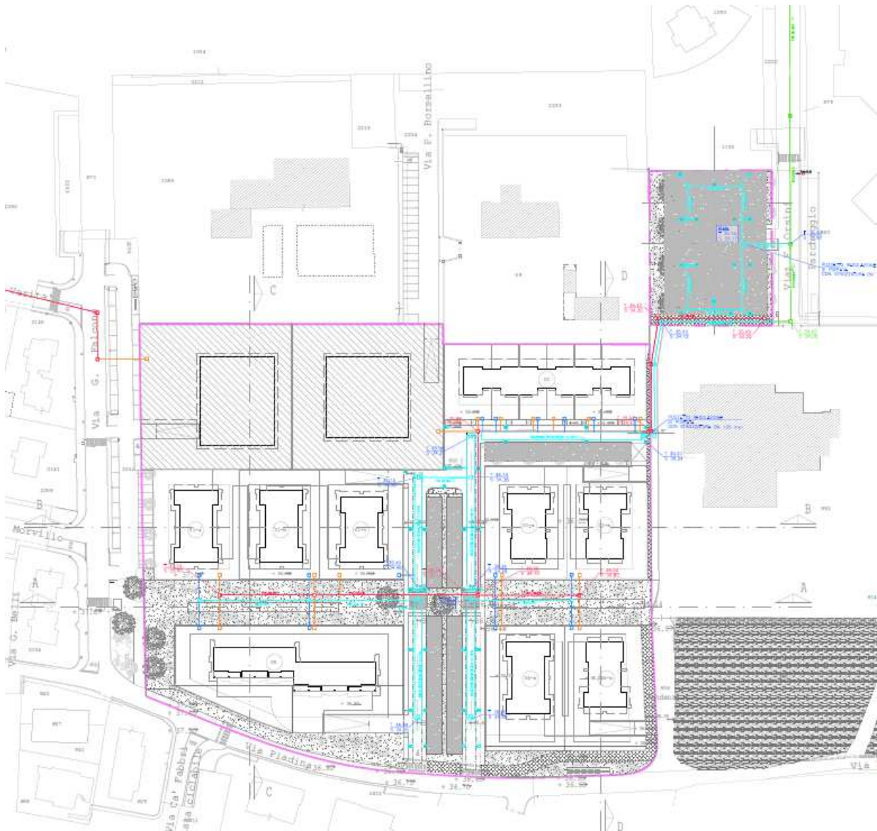
Fig. 3 – Schema reti fognarie di progetto

Si evidenzia in conclusione che nel dimensionamento delle reti di progetto non sono volutamente state considerate le superfici relative alle aree già urbanizzate presenti lungo le viabilità confinanti con l'area di intervento (Via Piadina, Via Falcone, Via Orsini), così come non sono state considerate le superfici di dette viabilità, poiché continueranno a scaricare lungo le reti di raccolta attualmente esistenti che non risultano in alcun modo interessate dalle opere in progetto.