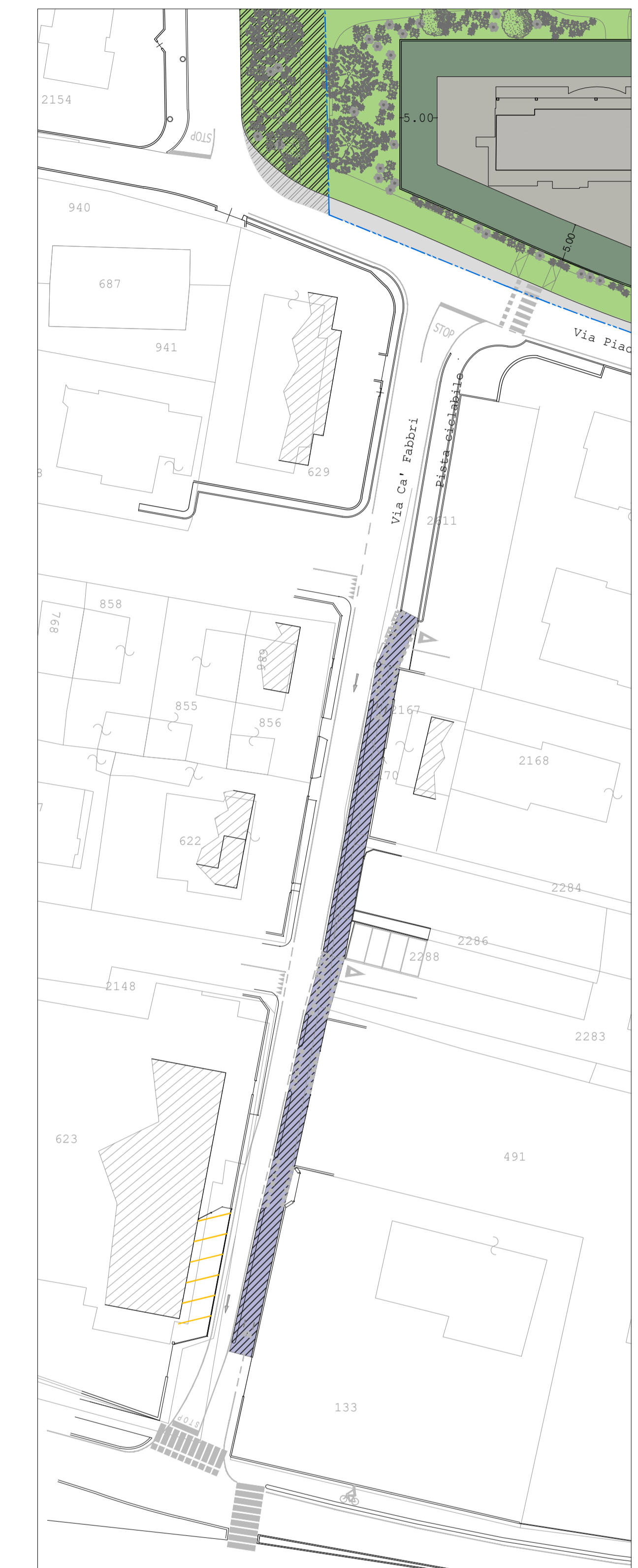
Planimetria pista ciclabile di Via Ca' Fabbrì Scala 1:500