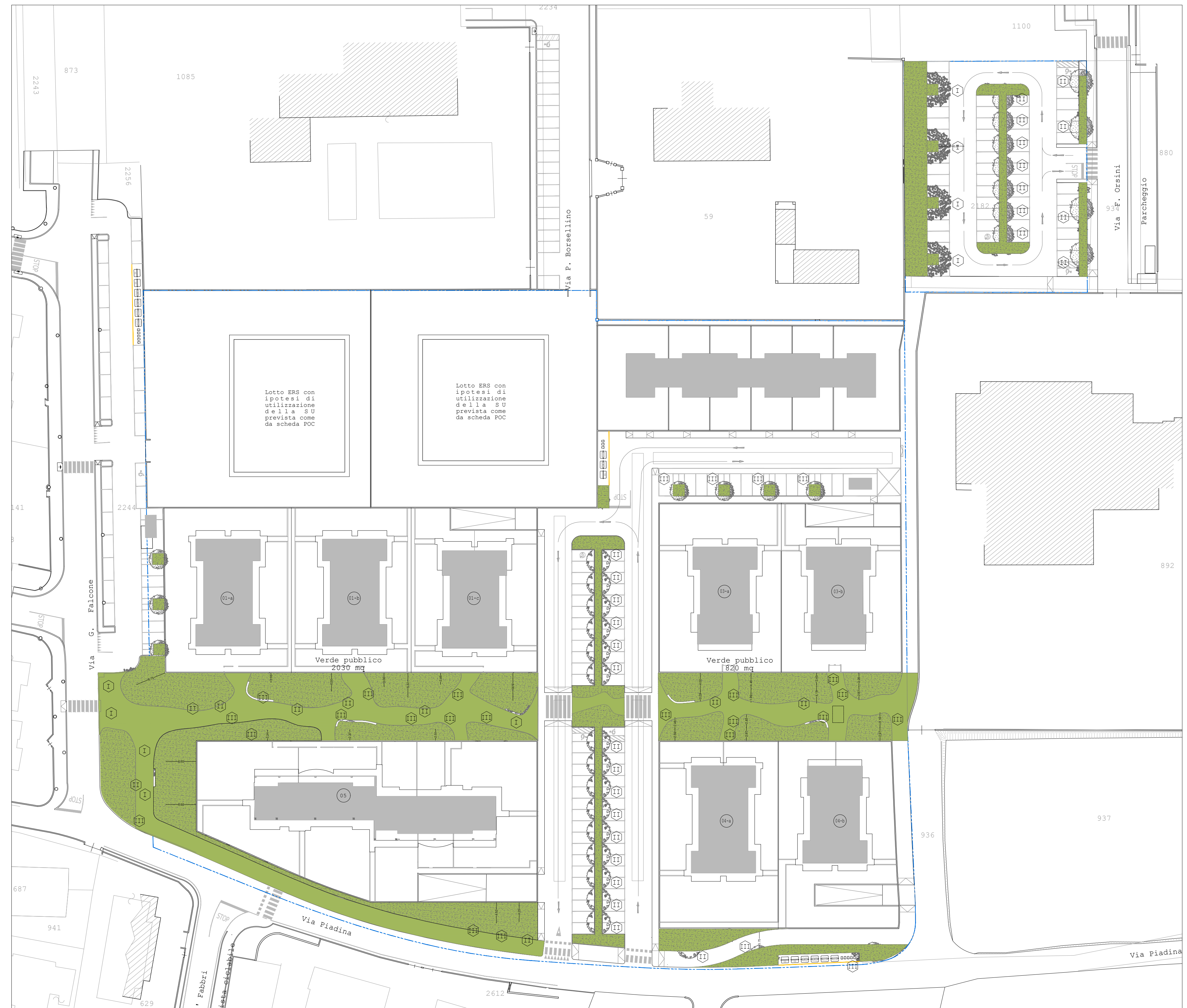
Planimetria generale - Sistemazione del verde pubblico 1:500