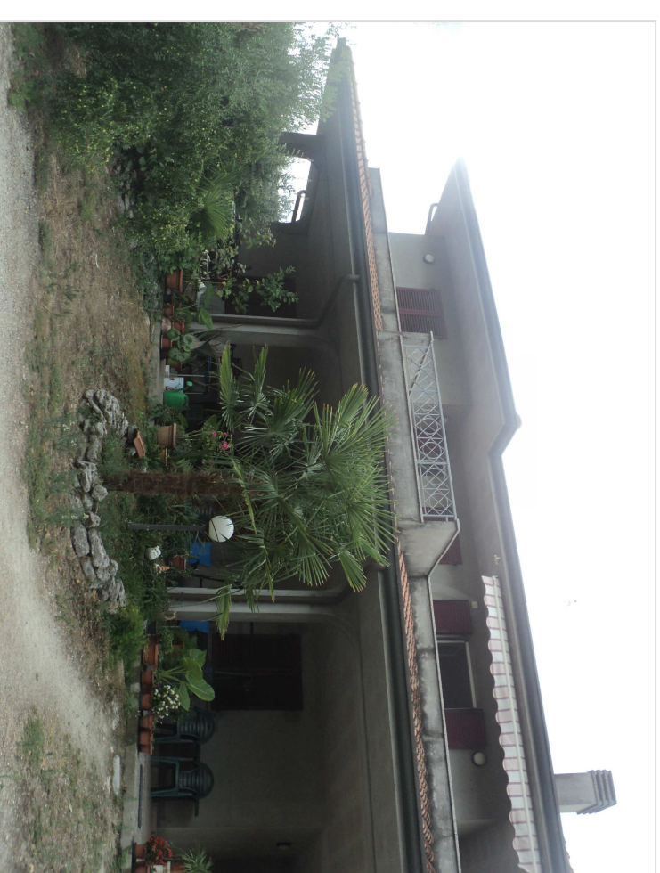
SCATTO FOTOGRAFICO N.1