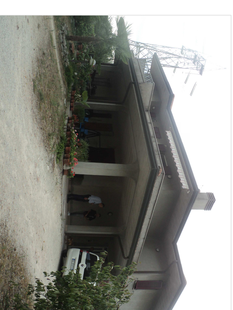
SCATTO FOTOGRAFICO N.3