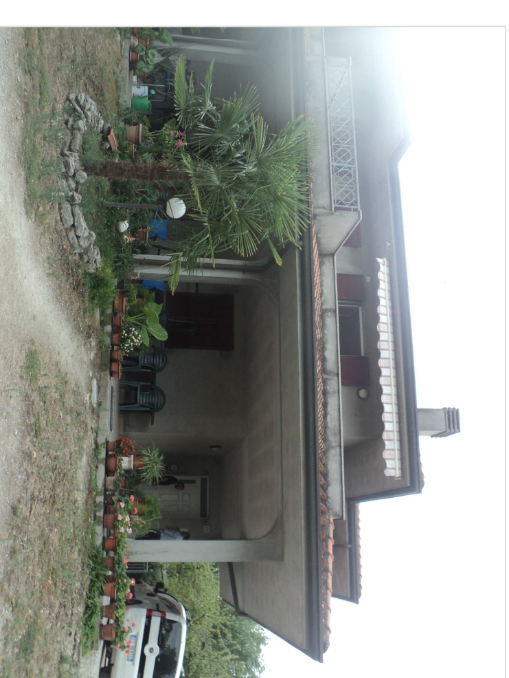
SCATTO FOTOGRAFICO N.2