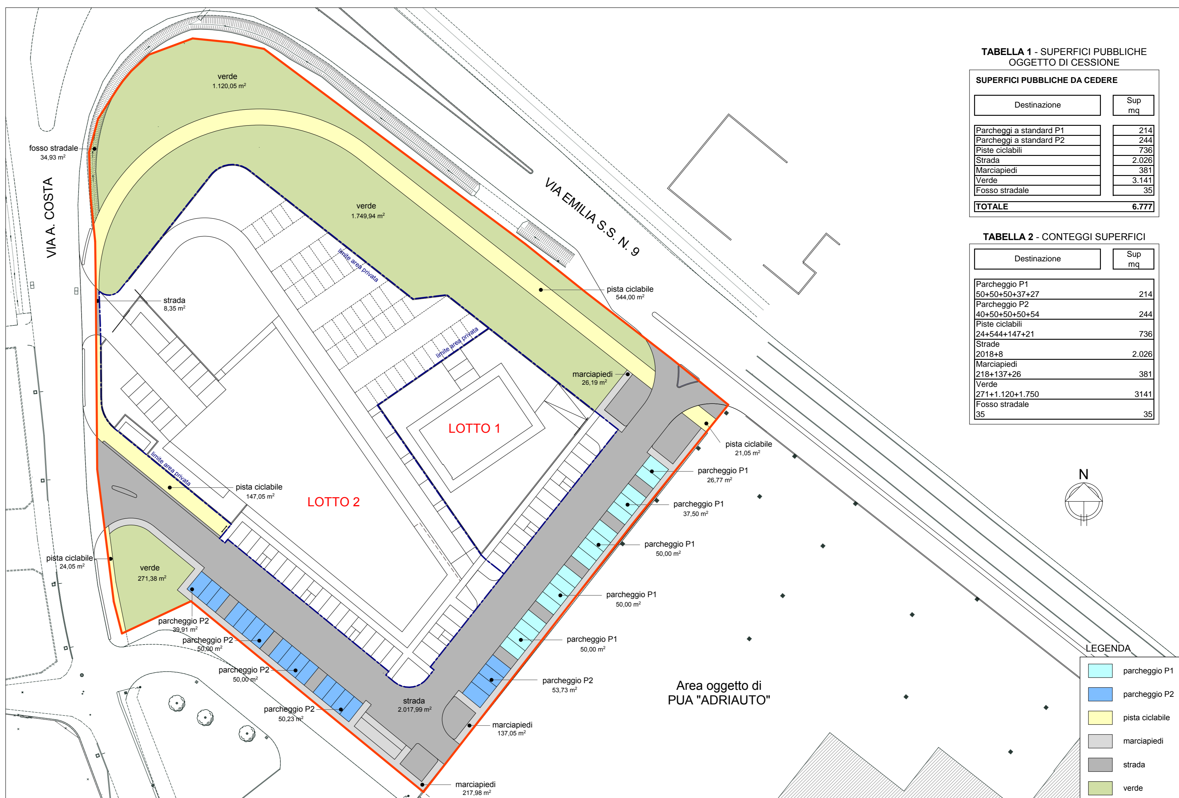
TABELLA 1 - SUPERFICI PUBBLICHE OGGETTO DI CESSIONE