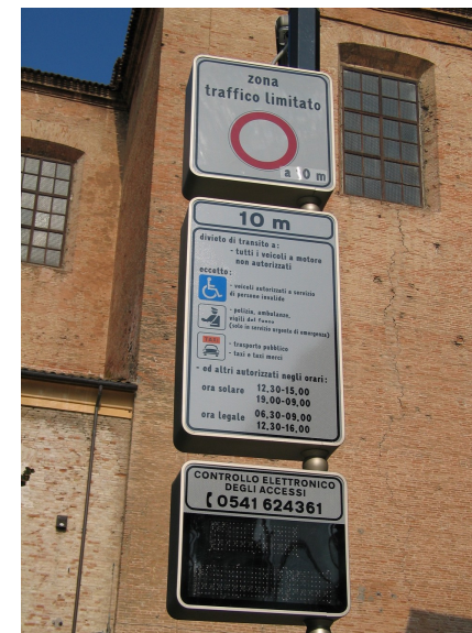
La segnaletica all'accesso della Zona a Traffico Limitato “C” in via De Bosis/via Battisti

Per informazioni è possibile contattare la Polizia Municipale (tel. 0541/624.361 - permessi.pm@vallemarecchia.it ). Per ulteriori approfondimenti è invece possibile consultare il sito www.comune.santarcangelo.rn.it , dove è disponibile anche il testo completo della “Regolamentazione del traffico veicolare nelle zone a traffico limitato”.